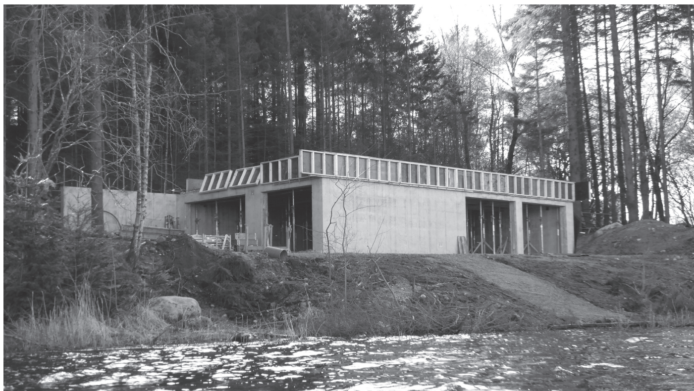
Jæren Kajakklubb er i ferd med oppføring av sitt klubbhus i Gunnarsberget. Vårt bidrag i 2019 kr. 200.000.