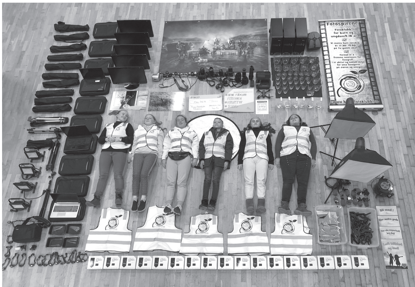
Bryne Fotoklubb sine Fotospirer som har fått kr. 60.000 til utstyr de siste to årene.